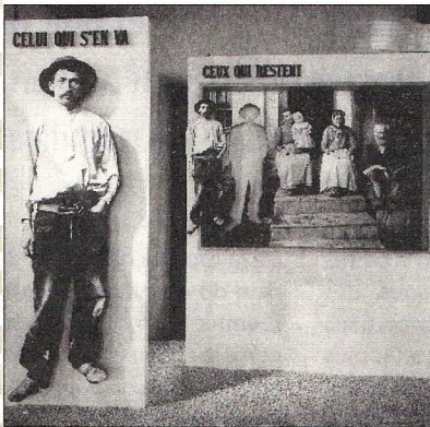
Exposition Les colporteurs fleuristes de l'Oisans (1975).