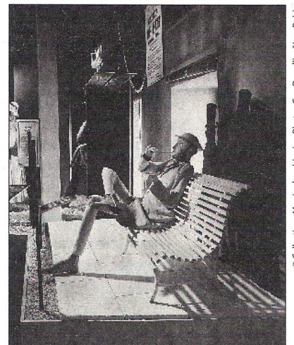
Exposition Le roman des Grenoblois (1982).