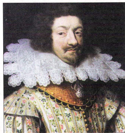
Charles de Gonzague.