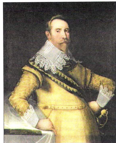
Gustave Adolphe de Suède.