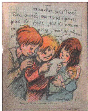
Petits écoliers de Poulbot.

(** ) Édouard Petit : De l'école à la guerre 1916