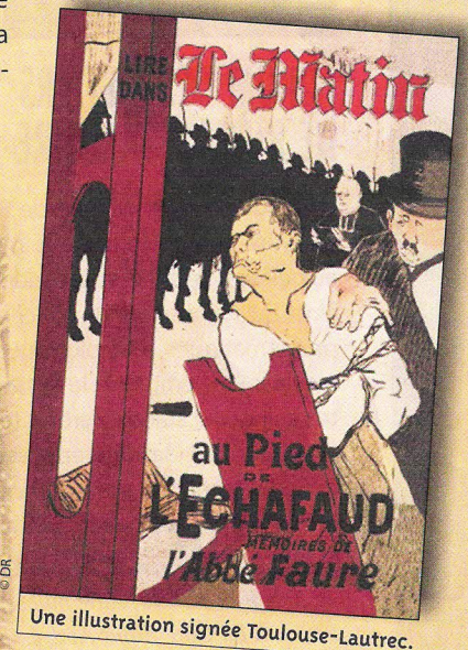
LES AFFICHES DE GRENOBLE ET DU DAUPHINÉ