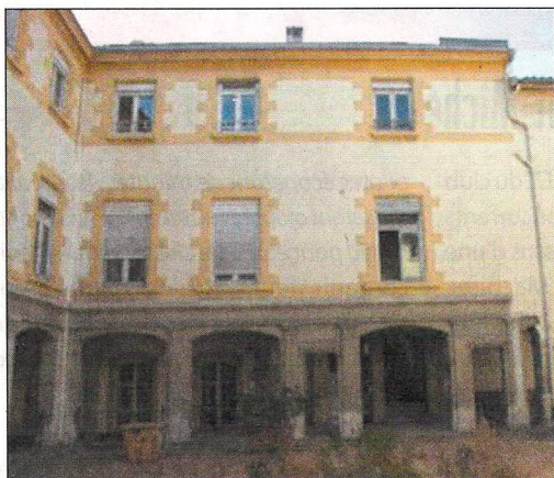
Hôpital de l’Antiquaille, Lyon.