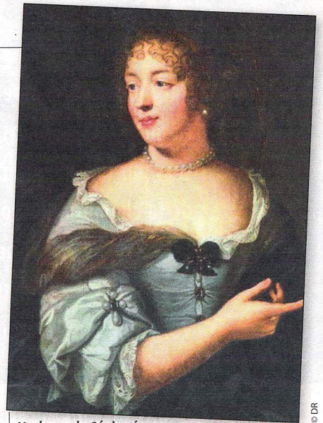
Madame de Sévigné.

Guérie et conquise, la marquise l’écrit à sa fille : « Pourquoi, ma bonne, dites-vous du mal de mon café au lait ? C’est que vous laissez le lait car sans cela