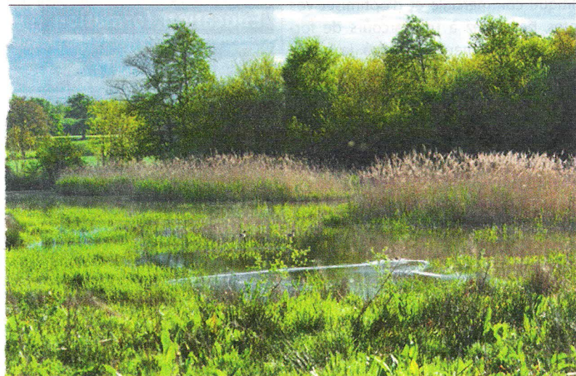
Marais et roselière.

Les travaux seront officiellement achevés en 1820... 144 ans après le premier coup de pioche!