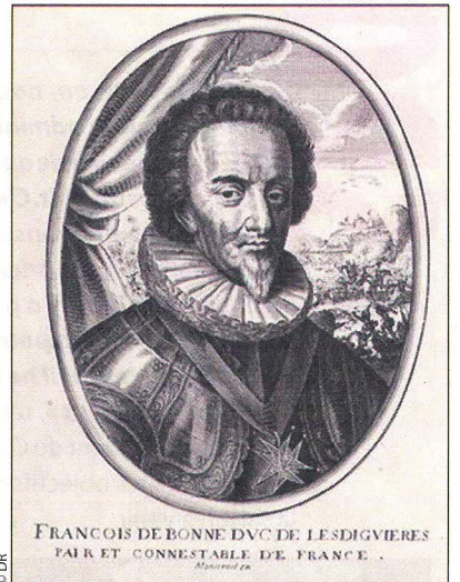
FRANCOIS DE BONNE DUC DE LESDIGUIERES FAIK ET CONNESTABLE DE FRANCE

Quant aux habitants, DAVITY les juge « affectionnés à leur prince mais fort jaloux et soigneux de leur liberté... Les habitants des villes sont affables et de bons et gentils esprits, capables de science et surtout des mathématiques, curieux chercheurs des secrets naturels, libres en paroles et sociables, mais un peu dissimulez et hault la main, ayant bonne opinion d'eux-mêmes et se vantant volontiers... Le peuple des montagnes dauphinoises est rude et grossier, peu-né aux lettres et propre aux armes et surtout adonné au traffic (sic) et au travail. Ces montagnards ont une coustume, qu'ainsi que l'hiver approche, ils envoient au loin ceux qui sont capables de travailler, tellement qu'il ne demeure au logis que les vieilles gens et les enfants qui ne peuvent marcher ou gagner leur vie. On appelle Bics ou Bisoiards tout ceux qui vont dehors et qui