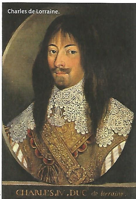
Charles de Lorraine.