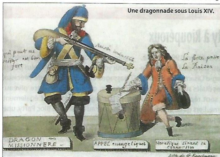
Une dragonnade sous Louis XIV.

Mais ce n'est pas tout, puisque « le jour de la prochaine fête de Notre-Dame, (condamné à) être mené par des archers et sergents, la tête nue et portant ladite torche allumée à la main, au-devant de la grande porte de l'église paroissiale de ladite ville, à l'issue de la Grand-Messe, et là, étant à genoux, après que la lecture lui aura été faite de la sentence, en